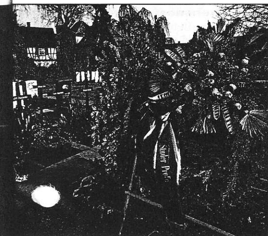
anz der Belegschaft.