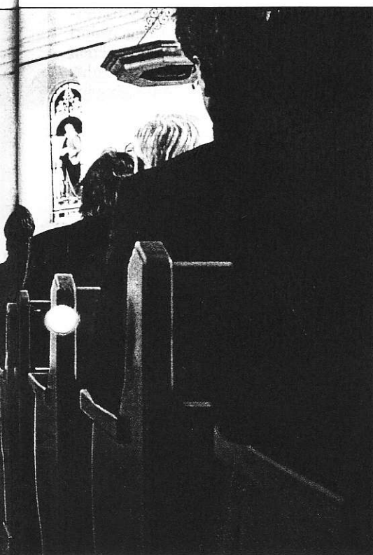
ne von Regensburg.

Firmenimperium mit 2000 Beschäftigten Ende der achtziger Jahre noch auf einen Wert von hundert Millionen Franken geschätzt wurde, verstarb als Inhaber eines letzten Rumpfbetriebes im Schwarzwald mit gerade noch 50 Arbeitsplätzen.