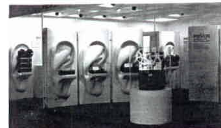
FOIRE NATIONALE SUISSE 1972, Lausanne. Wir freuen uns, dass bei 1500 Ausstellern unser Stand unter den 15 prämierten war.