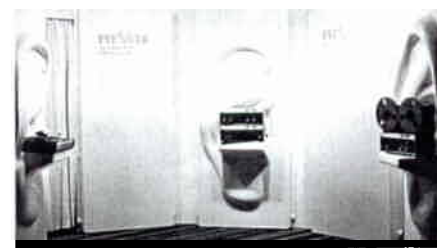
INTERNATIONALES JAZZFESTIVAL ZÜRICH Unsere Firma unterstützt seit vielen Jahren diese Veranstaltung und wir spenden auch wieder einen der Hauptpreise, ein Revox A77.

Leider hat sich im Leitartikel der letzten Nummer der Druckfehlerteufel eingeschlichen, so dass die Aussage des Artikels sinntfremd wurde. Wir wiederholen deshalb den Artikel im vollen Wortlaut.