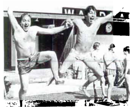
Die Foto dokumentiert am besten die fröhliche Stimmung des gelungenen Ausfluges.