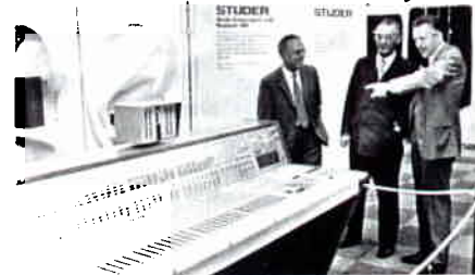
FERA 1972 ZÜRICH

U hie uf däm Hawge ged'r wie dr Hodu Wautu druf u dranne isch, üsem wärte Herr Studer s'erschte zwoinünnächzgi grad säuber zverhoufe