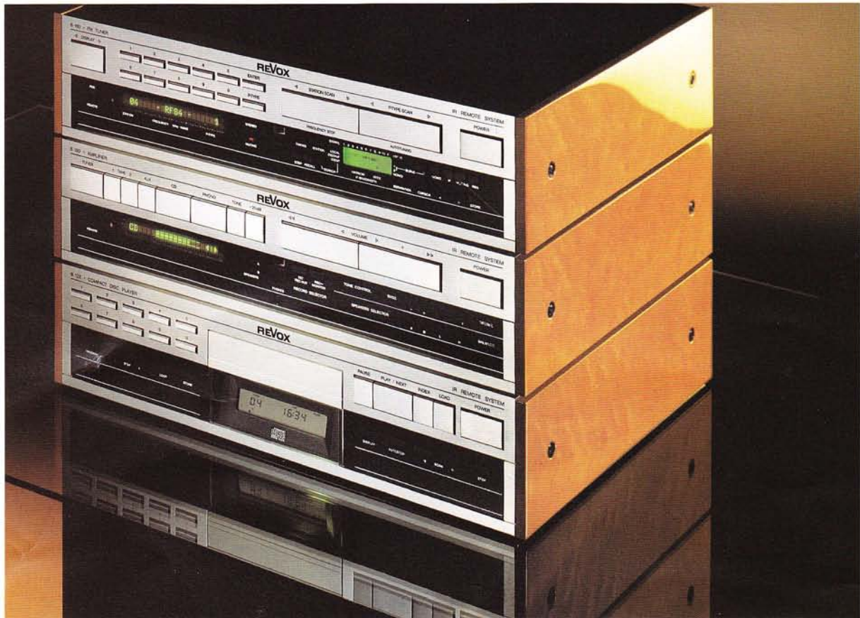
Ausführung: Vogelaugenahorn, Kirschbaum-Lasur, hochglänzend