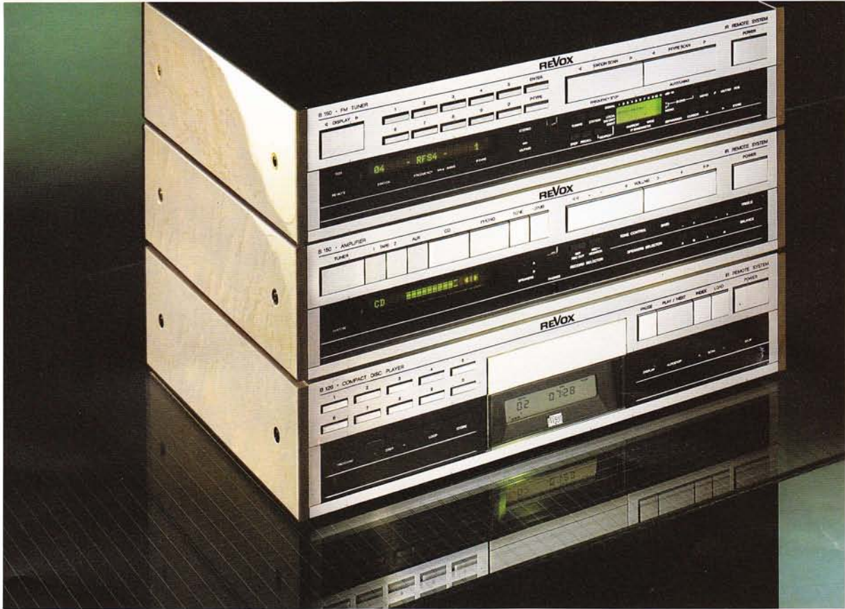
Ausführung: Vogelaugeoptern, hellgrau, hochglänzend