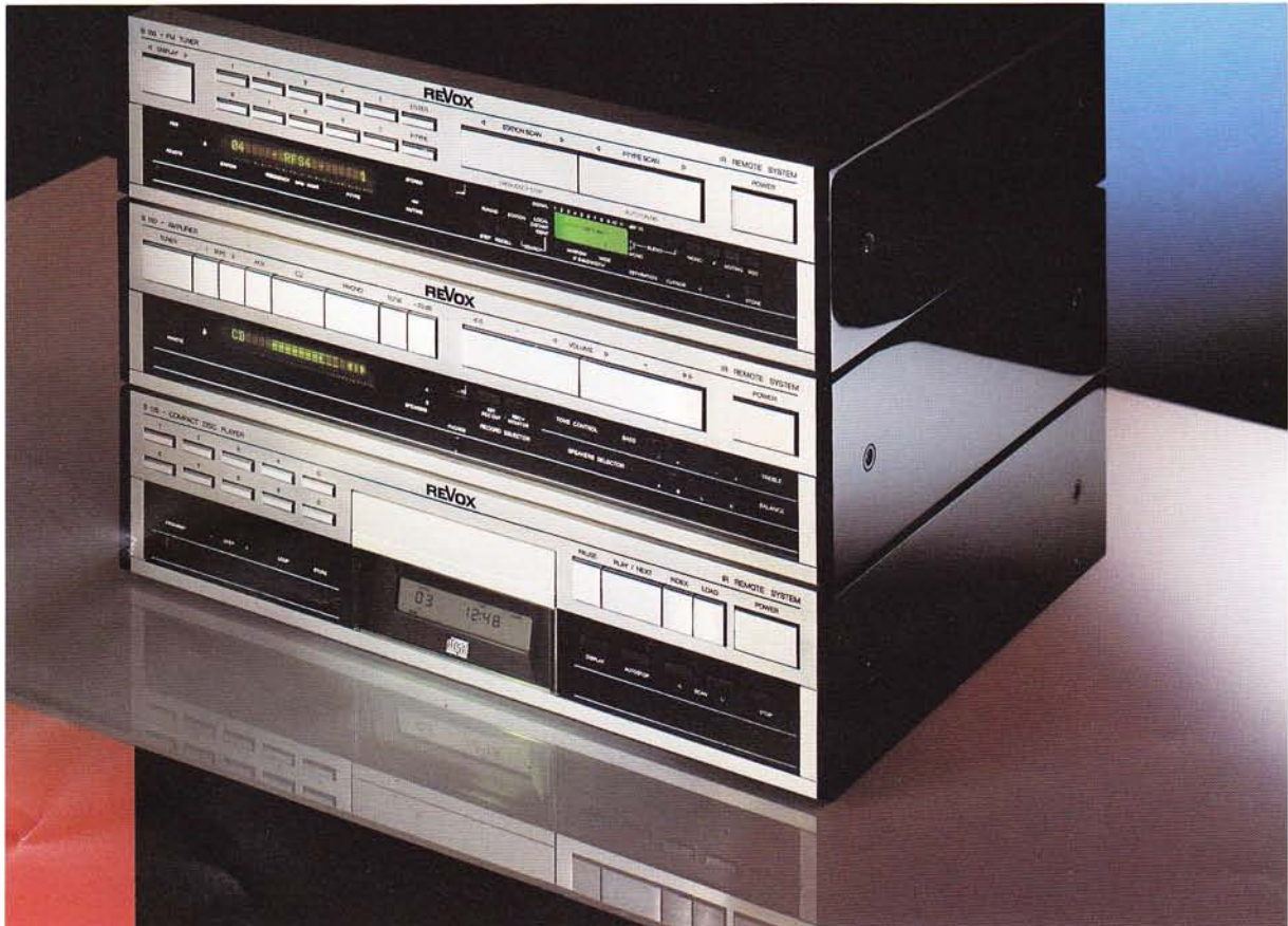
Ausführung: Klavierlack schwarz, hochglänzend