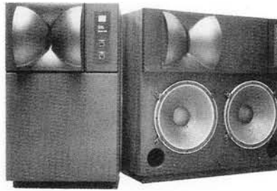
Links JBL 4430, daneben 4435. Der 4430 kostete 1988 rund 4.000 Mark, der 4435 5.100 Mark.