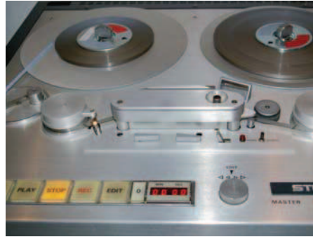
Studer A81 (1976)