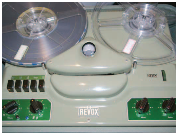
Revox A36 (1955)