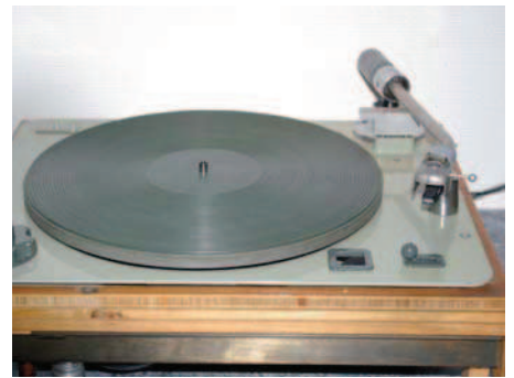
Plattenspieler Revox 60 (1954)

Text: Uwe Mehlhaff, Rolf Fischer