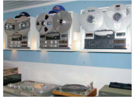
Evolutionsstufen der Revox PR99: MKI, MKII und MKIII (v. l.)