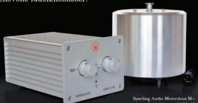
Sperling Audio Motordose M-1 mit Netzteil NRM-1/S