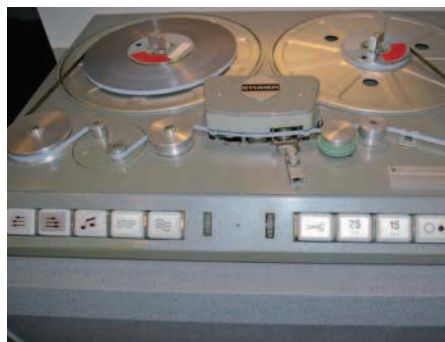
Studer C37 (ca. 1970)

Wirth Tonmaschinenbau GmbH Tel. (07127) 32718 Fax. (07127) 934186 www.acoustic-solid.de