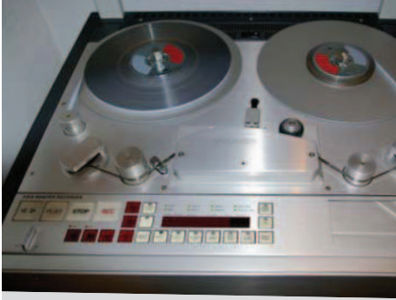
Studer A816 (Baujahr ca. 1991/1992, nur 186 Stück weltweit)