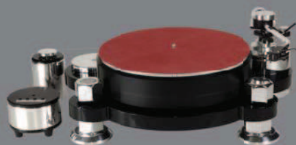
Solid Machine Black