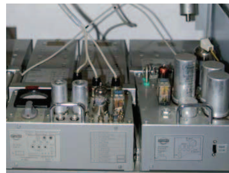
Studer C37 (Innenansicht)